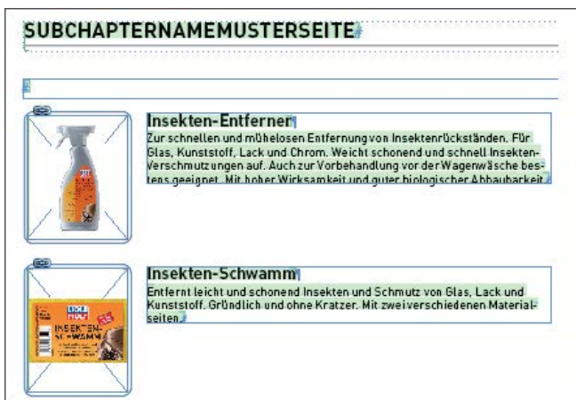
Abb.: InDesign-Template mit Live-Daten aus dem PIM befüllt

Nicht nur digitale Kommunikationskanäle sondern auch der Print-Kanal kann mit factor:plus PIM versorgt werden. Mittels Plug-In für Adobe InDesign werden ganze Kataloge, Prospekte und Print-Strecken systemgestützt voll- und teilautomatisch produziert. Durch die Verknüpfung von InDesign-Template und PIM-Daten stehen immer die aktuellen Informationen im InDesign-Dokument zur Verfügung. Der durchweg digitale Prozess reduziert Fehler und Korrekturschleifen. Die Produktionsvorläufe verkürzen sich wesentlich. Damit kann quasi bei Drucklegung auf den Wettbewerb reagiert werden. Mit factor:plus wird der komplette Werbemittel-erstellungsprozess abgebildet.