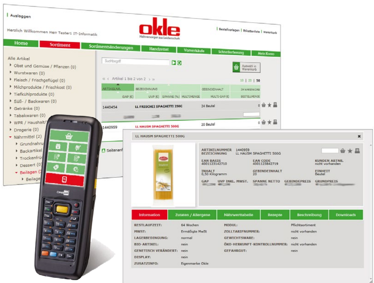
Abb.: Landmarkt-Informationssystem mit MDE-Lösung

Im Vergleich zu den alten Ordersätzen wurde sowohl die Quantität als auch die Qualität der Produktinformationen gesteigert. Durch die Anbindung des zentralen Artikeldatensamms und der Bilddatenbank von Markant werden we-